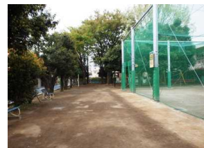
<緑がいっぱいだった公園>